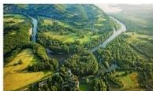
Vallée de la Dordogne